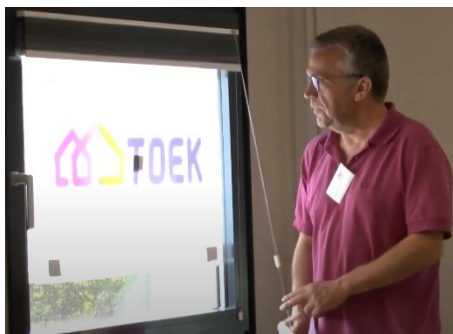
Onthulling nieuwe logo

In 2019 werd de ledenvergadering voor het eerst in twee sessies gehouden. Op 4 juni vormde De Trefkoele in Dalfsen het decor en op 11 juni was het de beurt aan de Museumboerderij in Staphorst. Naast de behandeling van de gebruikelijke onderdelen en de presentatie van de plannen voor het nieuwe jaar, werd het nieuwe logo van TOEK onthuld.